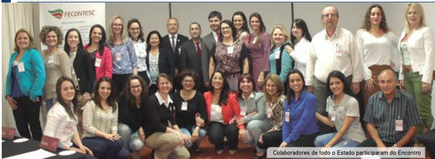
Colaboradores de todo o Estado participaram do Encontro