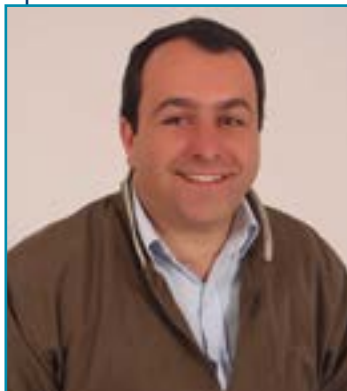
Evandro Frigo Pereira, prefeito eleito de Urupema

Os eleitos aqui divulgados foram listados a partir das fichas oficiais de inscrição apresentadas no Tribunal Regional Eleitoral, ou seja, aqueles que colocaram como ocupação a formação em Ciências Contábeis. Foram solicitados a todos um depoimento sobre a profissão e como ajudará na gestão da Prefeitura, apenas dois responderam e estão aqui publicados.