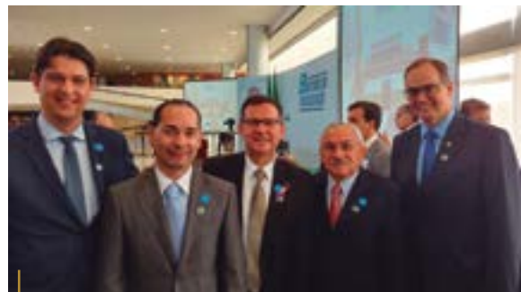
Presidentes do CRCSC e do CFC junto com outras lideranças

A proposta também regulamenta a figura dos investidores-anjo, aquelas pessoas que financiam com recursos próprios empreendimentos ainda em seu estágio inicial, como as startups, e