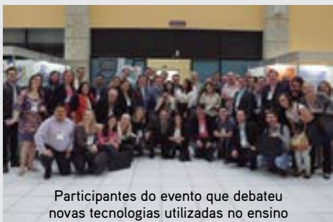
Participantes do evento que debateu novas tecnologias utilizadas no ensino