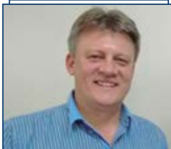
Emerson Ari Reichert, prefeito de Ipira