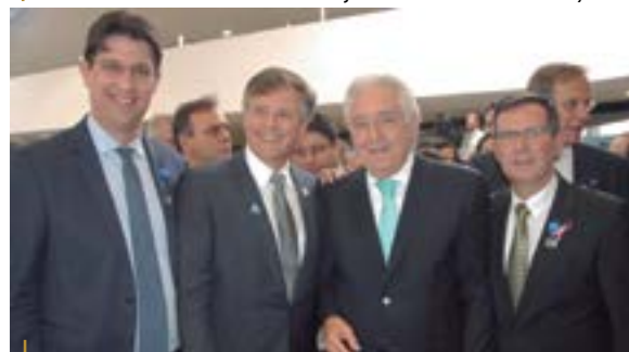
O presidente do Sebrae, Guilherme Afif Domingos, lançou o Mutirão de Renegociação

permite que os pequenos negócios do segmento de bebidas (cervejas, vinhos e cachaças) possam optar pelo Simples Nacional. Outro ponto de destaque é que os donos de salão de beleza poderão dividir os custos tributários com os profissionais que trabalham em parceria, além do estímulo à exportação com a simplificação dos procedimentos de logística internacional.